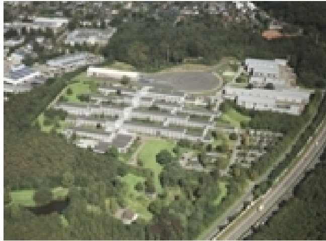
Fig.2-IL NUOVO CENTRO DI RICERCHE STRADALI IN GERMANIA (Bergisch Gladbach)

Basta citare il Regno Unito, che ha istituito il TRRL (Transportation and Road Research Laboratory) nel 1945, la Francia, dove per l'INRETS ci sono più di 20 laboratori sparsi su tutto il territorio nazionale, la Svezia, l'Olanda, la Germania (v. fig. 2). In Italia, invece, non esiste, ma, in compenso, vi operano molti ricercatori in piccoli gruppi, poco raccordati e non sistematicamente finanziati, che si arrangiano come possono.